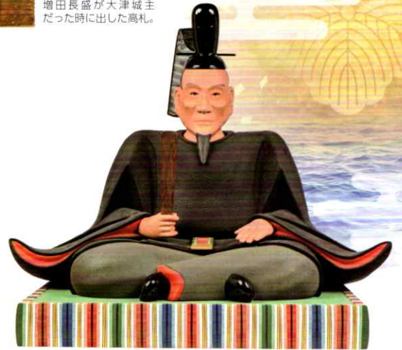
豊臣秀吉坐像 慶長4年(1599) 京都・西方寺蔵 秀吉の死後1年も経たずに造られた像。生前の秀吉の容貌に近いと考えられる。