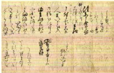
羽柴秀吉書状 (天正5年(1577)カ) 8月5日 東京大学史料編纂所蔵 織田信長家臣時代の秀吉が園城寺に宛てて出した書状。大津に建設中の土蔵に大工などを派遣したことに対する礼を述べている。