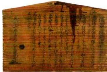
重要文化財 増田長盛高札 天正17年(1589) 2月15日 本館蔵 のちの五奉行の一人増田長盛が大津城主だった時に出した高札。