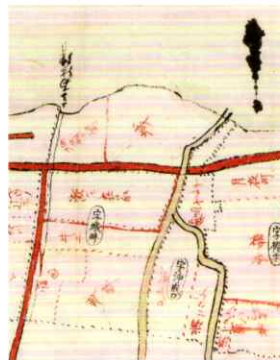
近江国滋賀郡下阪本村字園所絵図(部分) 明治14年(1881)11月 本館蔵 明治時代に作られた下阪本の絵図。坂本城の本丸があったところの字名が「城」となっている。