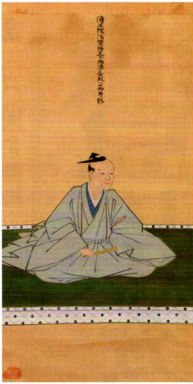
浅野長政像(部分) 江戸時代 兵庫県立歴史博物館蔵 秀吉の妻寧の義兄である浅野長政(長吉)を描いた数少ない肖像画。

天正二年（一五八三）、ライバルの柴田勝家を倒した羽柴秀吉は、坂本城に入りました。ここから秀吉と大津の深い関係が始まります。その三年後、秀吉は坂本城を廃し、新たに大津城を築きました。この城に、一族の浅野長吉（長政）や信頼する側近たちを次々と送り込み、秀吉自身も何度も足を運ぶなど、大津を重要な拠点として位置付けました。 また、秀吉は大津の寺社にも大きな影響を与えました。焼き討ちによって甚大な被害を受けた延暦寺や日吉社の復興を許し、堂舎の再建や法会・祭礼などの再興を助けたのです。その一方で、信長家臣時代から良好な関係を築いていた園城寺（三井寺）に対しては、突然闕所（取り壊し）命令を出し、土地や建物を没収するという厳しい一面も見せました。 さらに、各所に自分の直轄地（蔵入地）を設定し、山林の争いを解決し、漁業の権利を認めるなど人々の暮らしにも深く関わりました。今回の展示では、城や寺社、村などの視点から、秀吉が大津に残した足跡をご紹介します。また、坂本城三の丸から発見された木製品を初公開します。